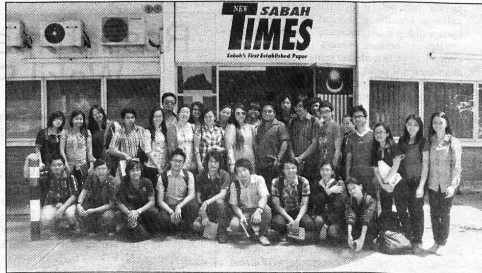
KENANGAN ... Sebelum berangkat balik, kesemua pelajar ini sempat mengabadikan kenangan di hadapan bangunan New Sabah Times.