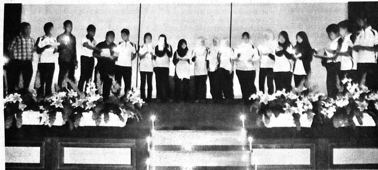
PELAJAR IPG Kent melakukan persembahan secara beramai-ramai.