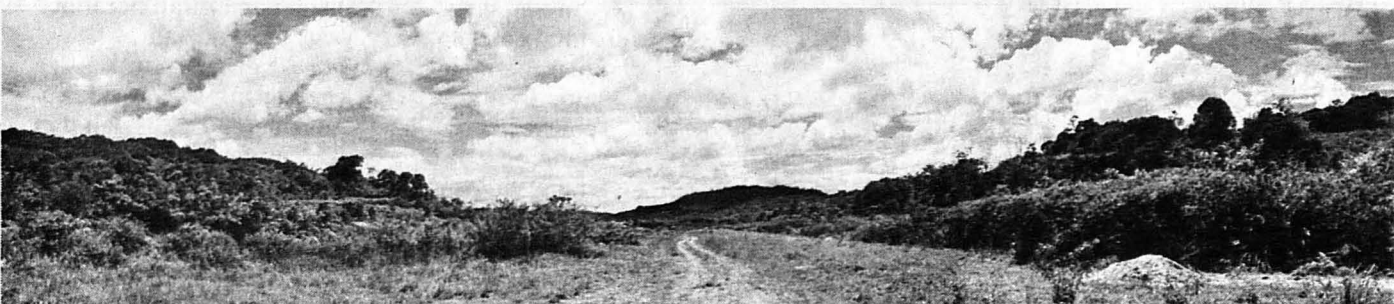
LANDASAN Kapal Terbang MAS di Long Pasia, kini tidak lagi digunakan kerana jalan raya ke Long Pasia telah siap pada tahun 1997.

Apatahlagi Sipitang mempunyai seluas 215,462 hektar hutan simpan, yang merupakan 70 peratus daripada keluasan daerah Sipitang.