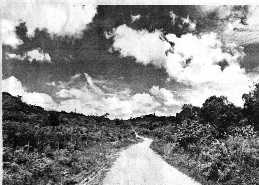
JALAN raya ke Long Pasia.