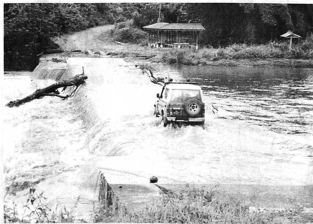
CABARAN ke Long Pasia dengan aliran air sungai yang melepasi laluan konkrit.