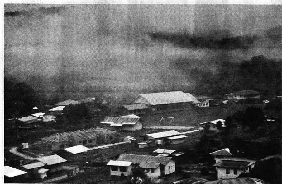
PAGI yang dingin di Long Pasia.