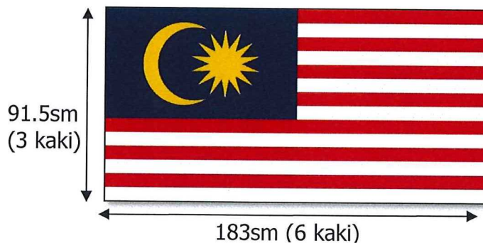
Rajah 1 : Ukuran bendera

Saiz bendera yang akan dikibarkan di luar bangunan hendaklah berukuran biasa iaitu 91.5m (3 kaki) lebar; dan 183m (6 kaki) panjang.