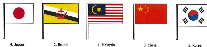
Rajah 3 : Susunan bendera (pandangan dari luar bangunan)