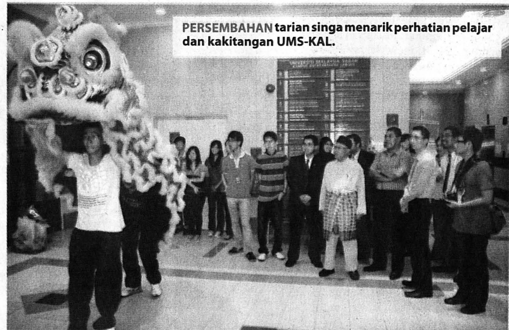
PERSEMBAHAN tarian singa menarik perhatian pelajar dan kakitangan UMS-KAL.