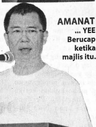
AMANAT ... YEE Berucap ketika majlis itu.

"Apabila masyarakat memahami keadaan ini, barulah mereka boleh bekerjasama dengan pihak polis untuk mencegah jenayah," jelasnya.