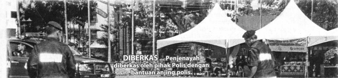
DIBERKAS ... Penjenayah diberkas oleh pihak Polis dengan bantuan anjing polis.