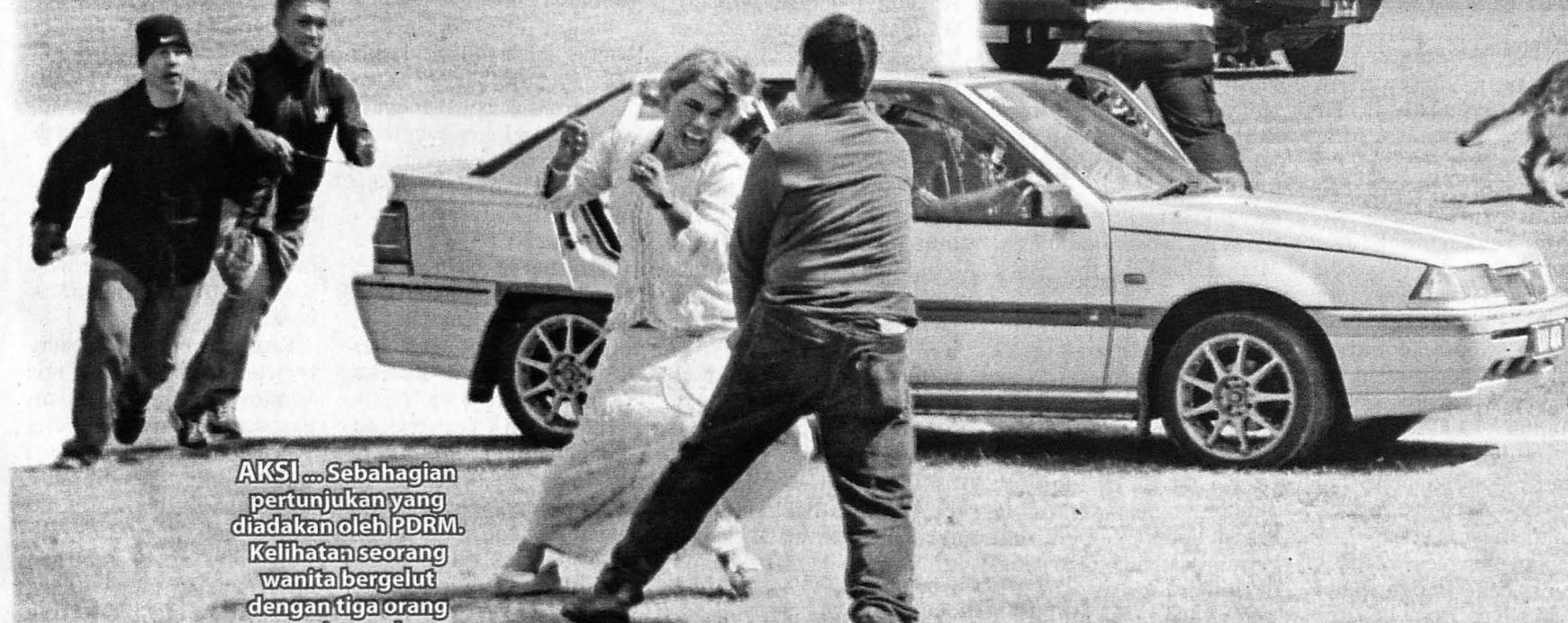
AKSI ... Sebahagian pertunjukan yang diadakan oleh PDRM. Kelihatan seorang wanita bergelut dengan tiga orang penjenayah.