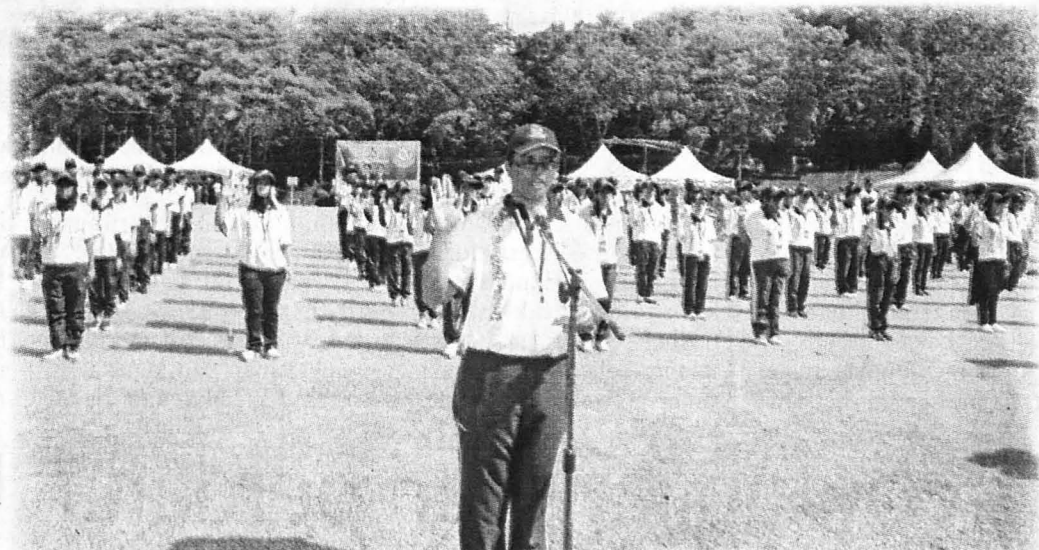
BERIKRAR ... Bacaan ikrar generasi bebas jenayah oleh kumpulan Rakan Muda.