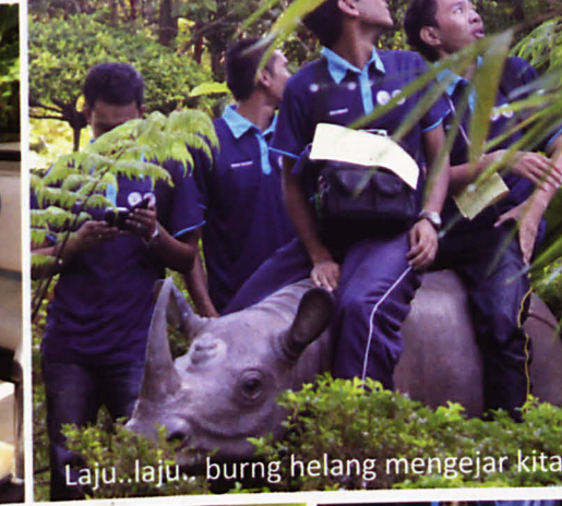
Laju..laju.. burung helang mengejar kita