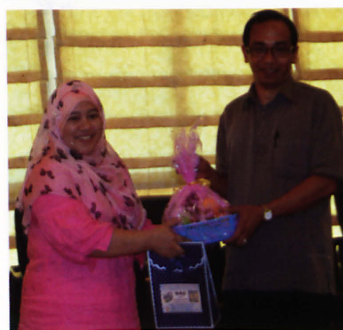
Jutaan terima kasih kepada En TJ