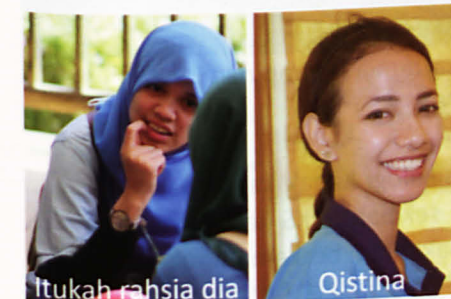
Itukah rahsia dia