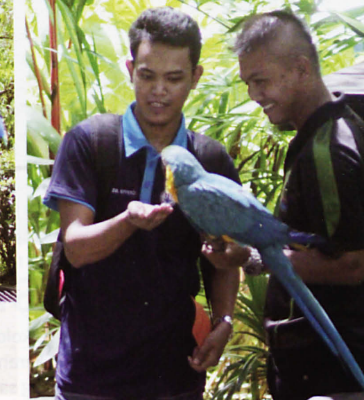
Burung nuri peramah