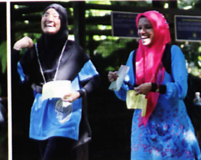
Tak kering gusi ikut program ni