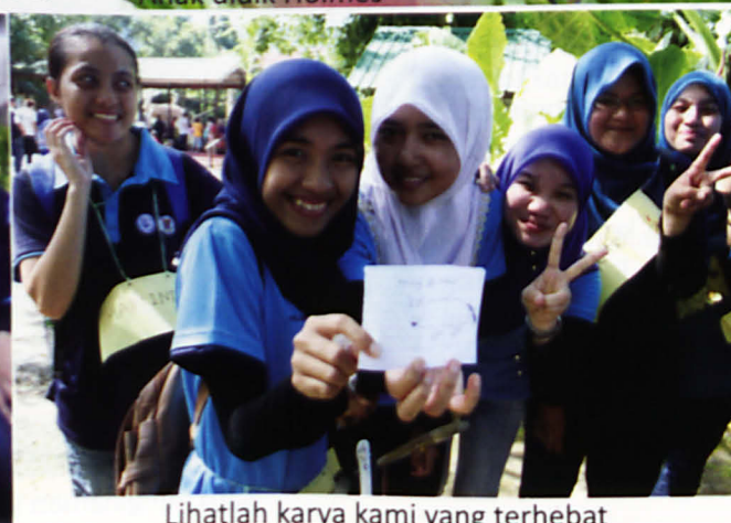
Lihatlah karya kami yang terhebat