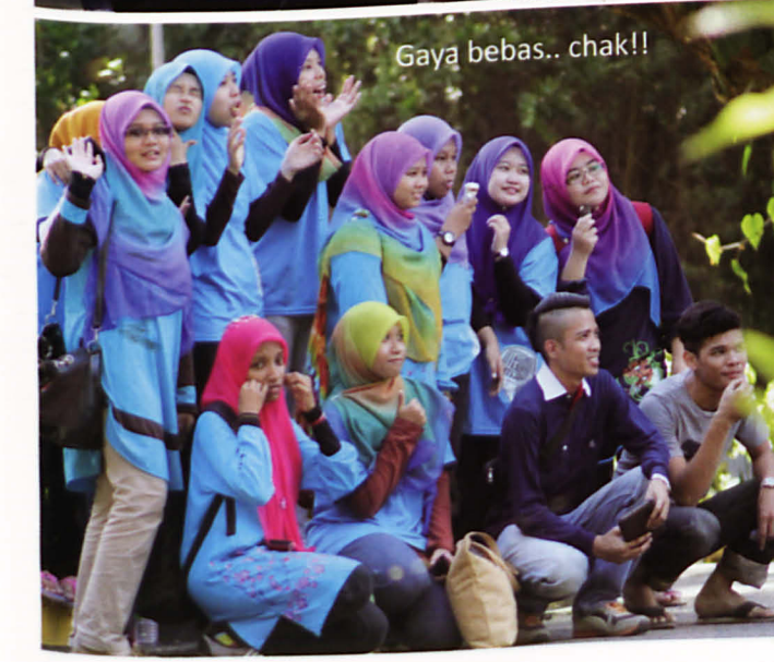
Gaya bebas.. chak!!