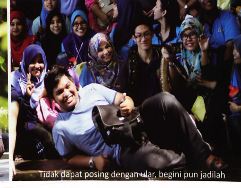
Tidak dapat posing dengan ular, begini pun jadilah