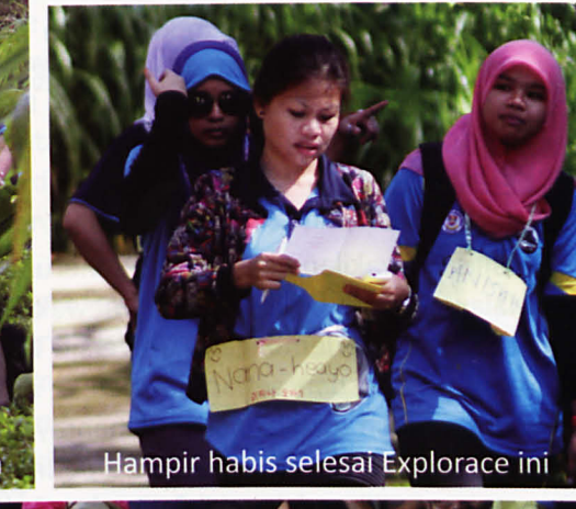
Hampir habis selesai Explorace ini