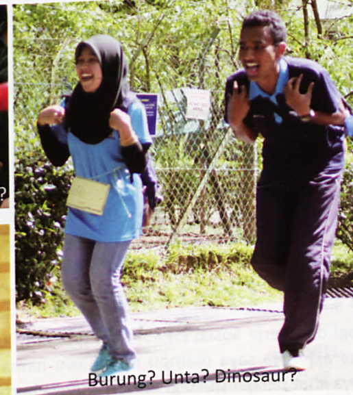
Burung? Unta? Dinosaur?