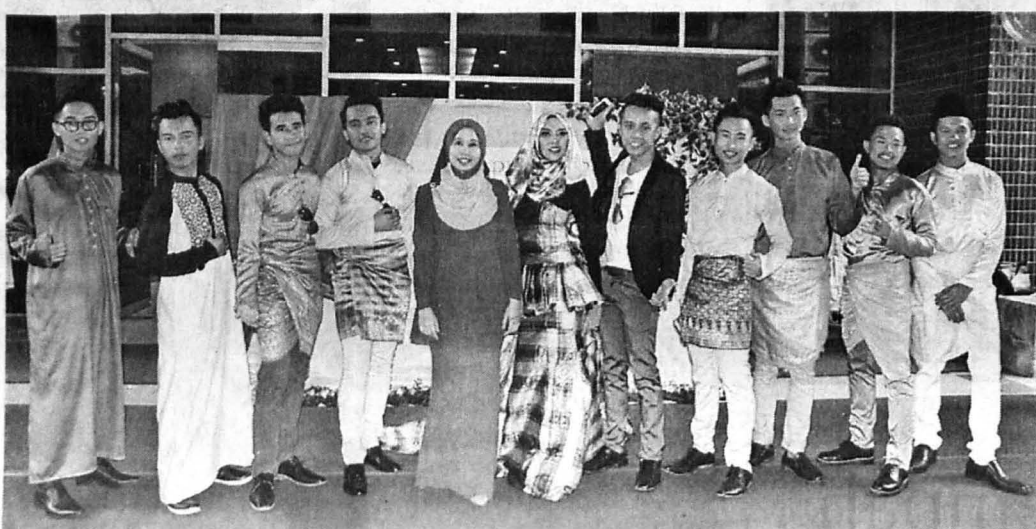
MODEL lelaki menggayakan pakaian sempena program Inspirasi Usahawan UMSKAL 2015.