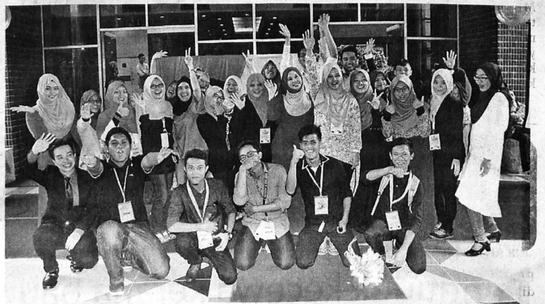
AJK Penganjur Inspirasi Usahawan UMSKAL 2015.