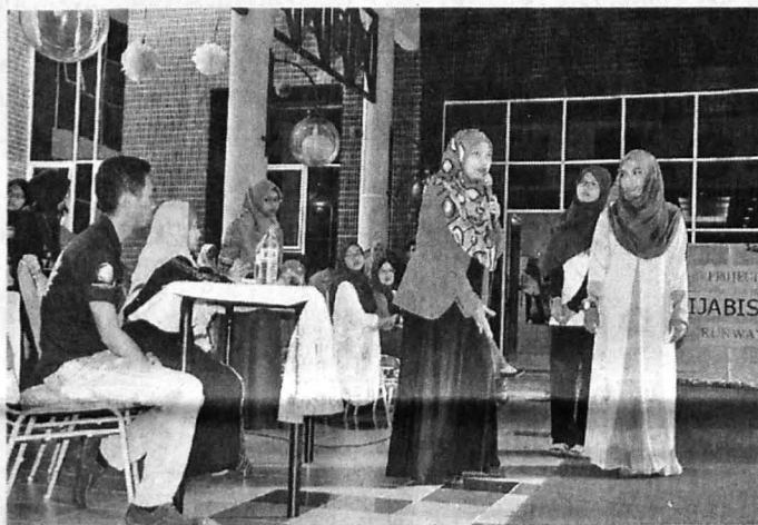
JURI memberikan ulasan peragaan peserta pertandingan.

Beliau tidak lupa mengucapkan terima kasih kepada semua pihak yang membantu menayakan program Inspirasi Usahawan UMSKAL 2015.