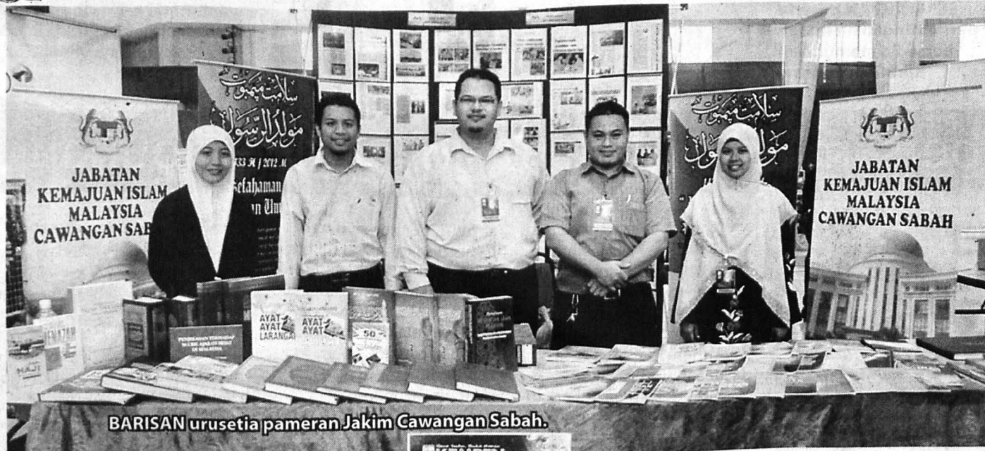
BARISAN urusetia pameran Jakim Cawangan Sabah.

Pameran kali ini telah disertai oleh hampir 50 agensi