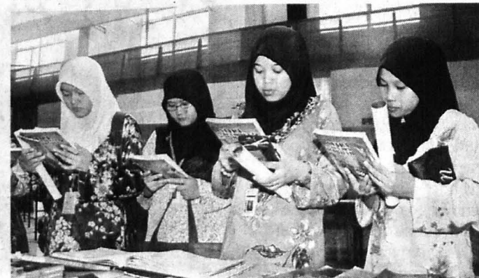
ANTARA pengunjung yang sangat tekun meneliti buku pameran di booth Jakim.

kakitangan Jakim Cawangan Sabah namun hanya 339 pengunjung yang mendaftarkan diri di buku daftar pelawat booth Jakim.