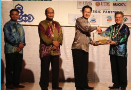
Third Int'l Conference on ICIDM on Dec 2-4

By MICHAEL TAN Michael.Tan@masatias.com.my ICIDM 2014 features digital and interactive devices that allow the public to interact with the content. They will be here or online. The third International Conference on Interactive Digital Media (ICIDM) 2014 will be held in Kota Kinabalu, Sabah, Malaysia, on December 2-4. The event is organized by the Universiti Malaysia Sabah (UMS) Faculty of Computer Studies, Information Systems and Multimedia (FCSIM) in collaboration with Universiti Teknologi Malaysia (UTM) and Universiti Kebangsaan Malaysia (UKM). The conference will feature keynote speeches and presentations by leading experts in the field of interactive digital media. The event will also feature a series of workshops and seminars on the latest trends in interactive digital media. The event is expected to attract a large number of participants from around the world.