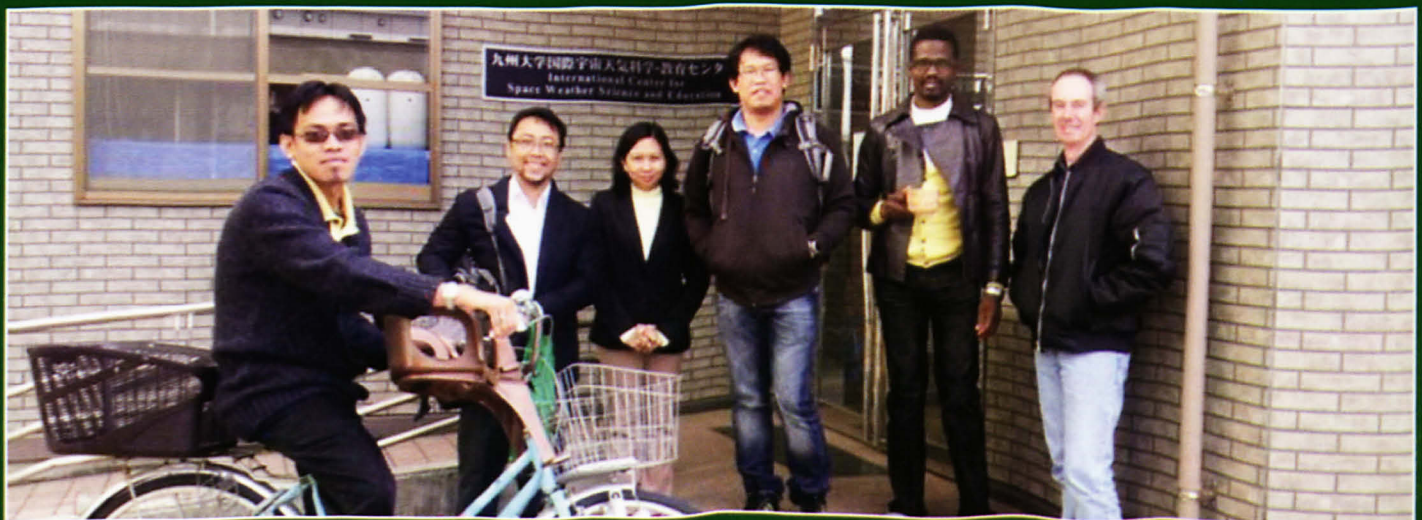
Sayonara kudasai Japan!