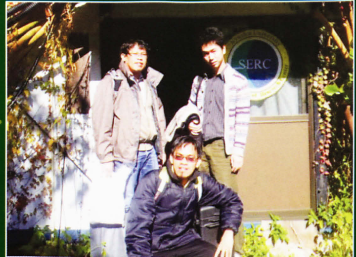
Bergambar kenangan di hadapan makmal Sasaguri, Kyushu, Jepun.