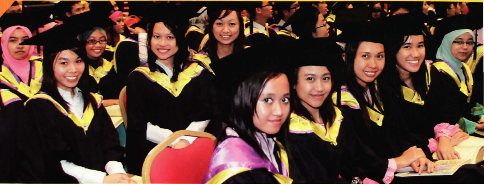
Statistik Graduan SSMP Tahun 2011