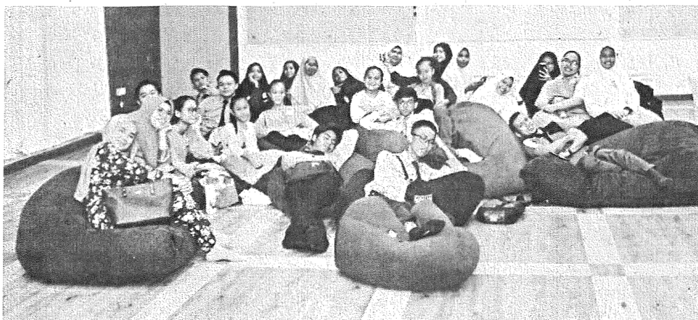
SANTAI: Pelajar SMK Taman Perumahan Bedaun berehat santai di Bilik Eureka, Bangunan Menara UMSKAL.

UMSKAL kini menawarkan tujuh program iaitu lima di Fakulti Kewangan Antarabangsa Labuan (FKAL) dan dua program di FKI.