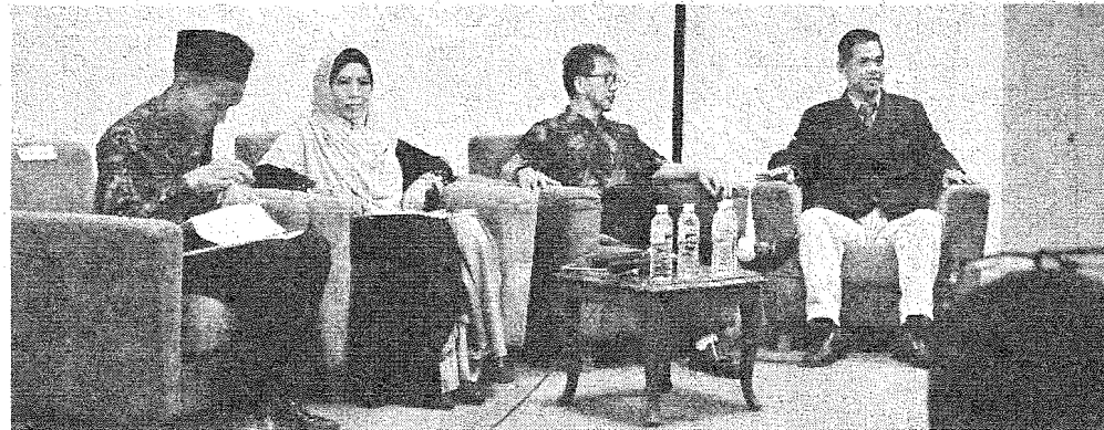
PANEL: Barisan panel Diskusi Hal Ehwal Sejagat 2019 dan moderator.

Selain itu, program itu mampu melahirkan pelajar dan mahasiswa yang berintegriti selaras dengan tema program ini iaitu 'Kesepakatan Membangun Generasi Berintegriti'.