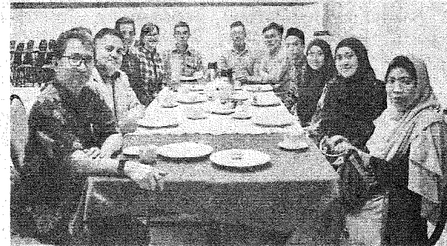
TETAMU UNDANGAN: Barisan VIP bersama ahli panel, bekas pegawai Arkib Negara Malaysia dan jemputan.

tidak terus menular dalam kalangan masyarakat pada masa akan datang.