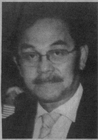
CATATAN KANVAS KOYAK