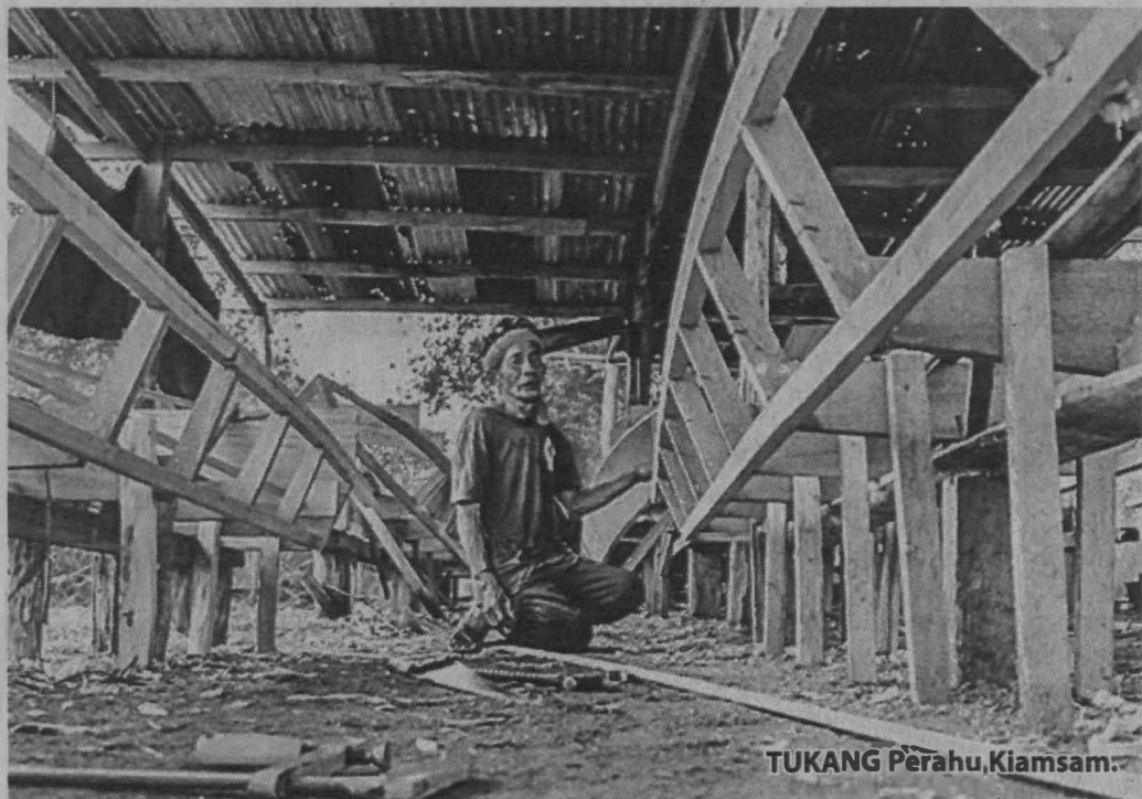
TUKANG Perahu, Kiamsam.

***PENULIS merupakan Pensyarah Seni Visual, Fakulti Kemanusiaan, Seni dan Warisan di Universiti Malaysia Sabah (UMS).***