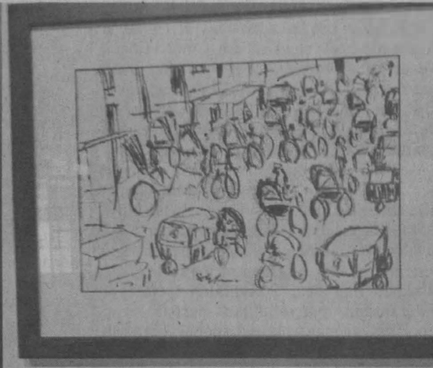
JALAN DI DHAKA, BANGLADESH