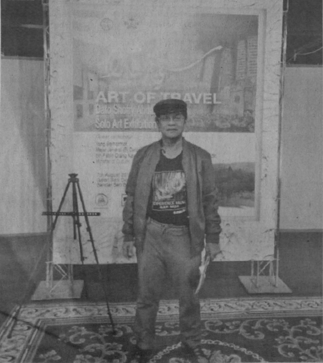
PENULIS: Di Galeri Dermaga Diraja Brunei.

***PENULIS merupakan Pensyarah Seni Visual, Fakulti Kemanusiaan, Seni dan Warisan di Universiti Malaysia Sabah (UMS).***