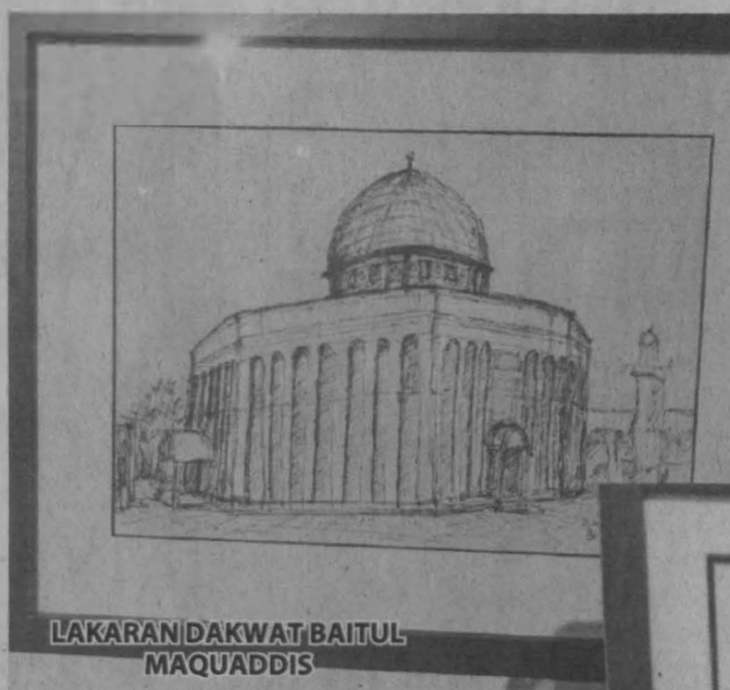
LAKARAN DAKWAT BAITUL MAQUADDIS

beliau yang di sampaikan kepada penulis terdapat dua buah galeri yang di negara asing yang memukau beliau umpamanya Muzium Mindanao City dan Tehran Museum of Contemporary Art, negara Iran.