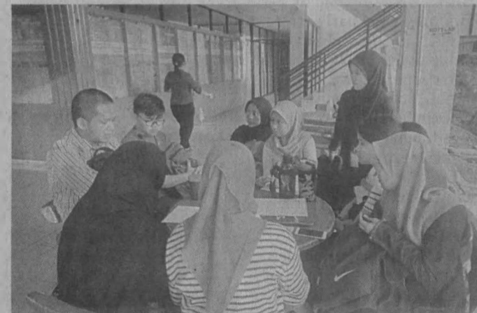
BERBINCANG: Proses muzakah secara berterusan dilihat sebagai suatu usaha penambahbaikan dalam proses menuntut ilmu melalui suasana perbincangan secara berhemah.

bermanfaat. Di dalam proses menuntut ilmu, penuhilah masa adik-adik siswa/i dengan kegiatan yang sihat dan bermanfaat. Proses menuntut ilmu tidak hanya berlaku di dalam bilik kuliah atau tutorial sahaja, malah ia boleh dipanjangkan di luar dari ruang lingkup kawasan berkenaan.