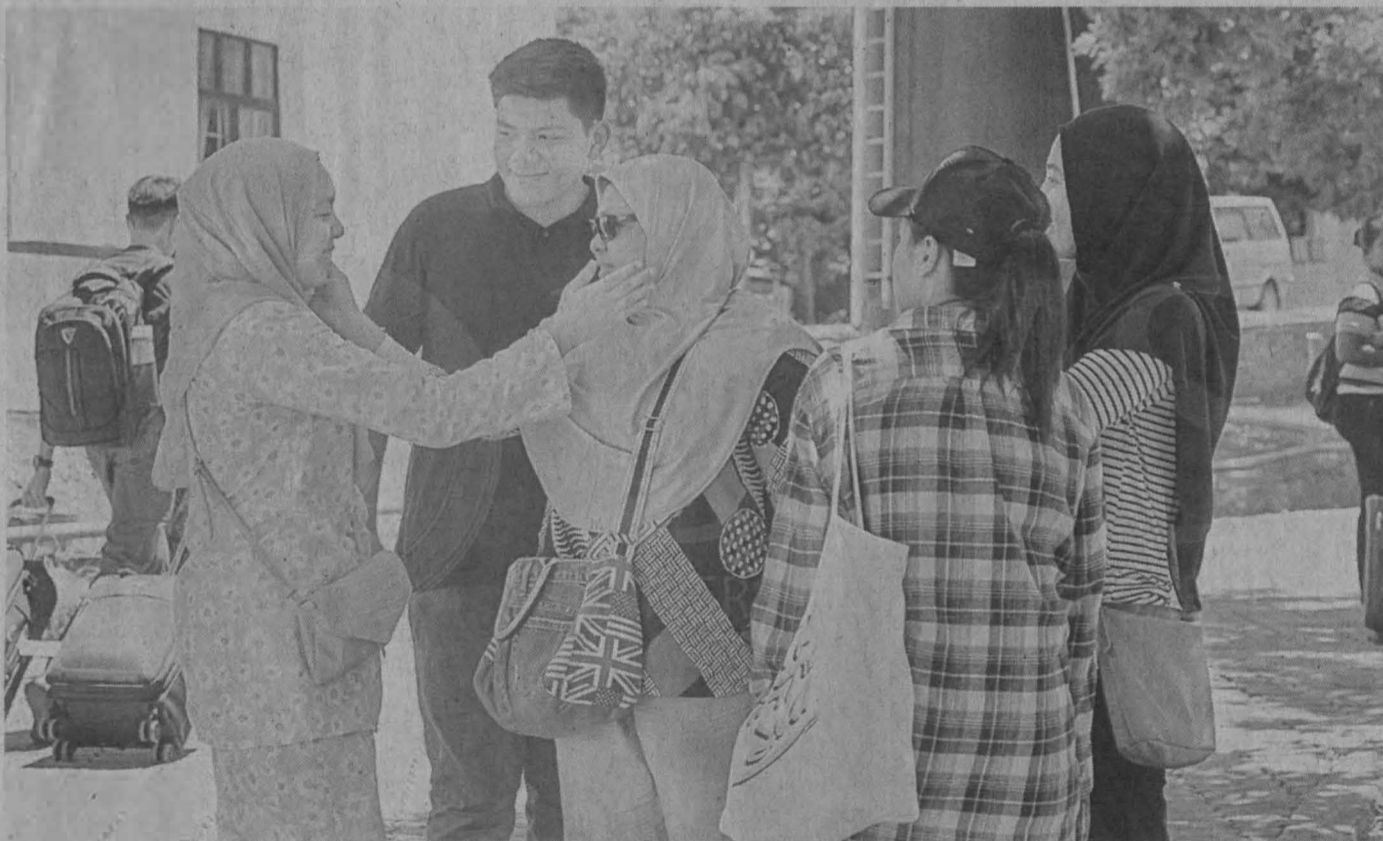
HUBUNGAN DENGAN ORANG TUA: Hubungan kepada kedua orang tua sangat penting sebagai seorang mahasiswa bukan sahaja antara amalan penting dalam adab menuntut ilmu tetapi juga kebahagiaan dan kesejahteraan hidup.