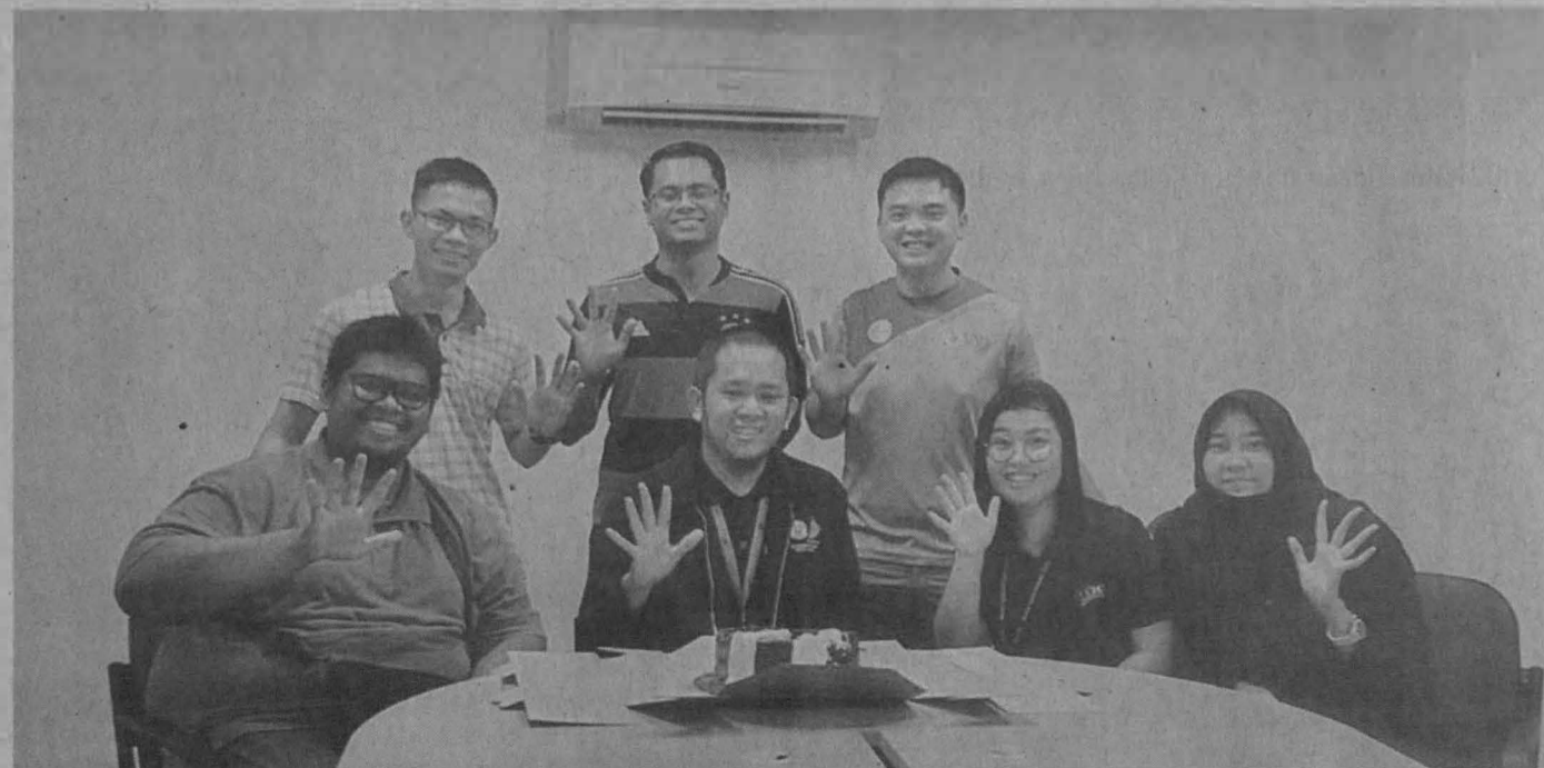
JAGA HUBUNGAN: Sentiasa menjaga hubungan baik dengan pensyarah juga sangat penting dan sebahagian daripada adab menuntut ilmu.