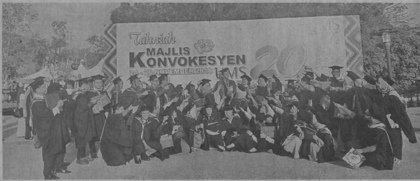
TAMAT PENGAJIAN: Setelah berusaha pastilah mencapai tangga kejayaan.

Apabila adab menuntut ilmu dijaga dengan baik