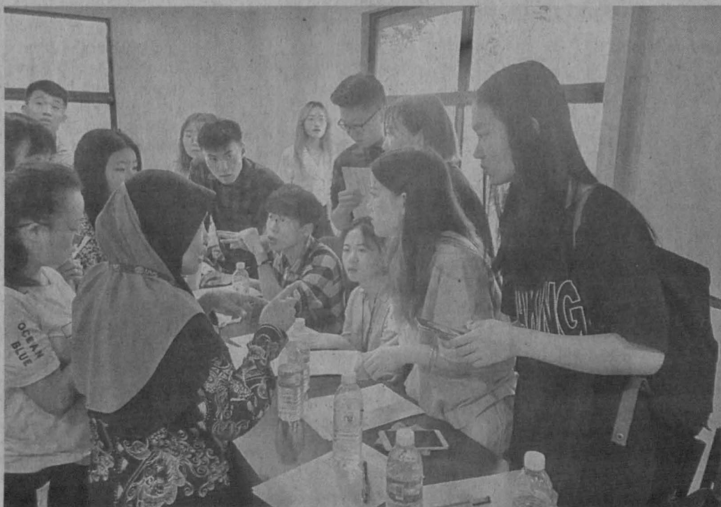
PENAMBAHBAIKAN: Muzakah secara berterusan penting.