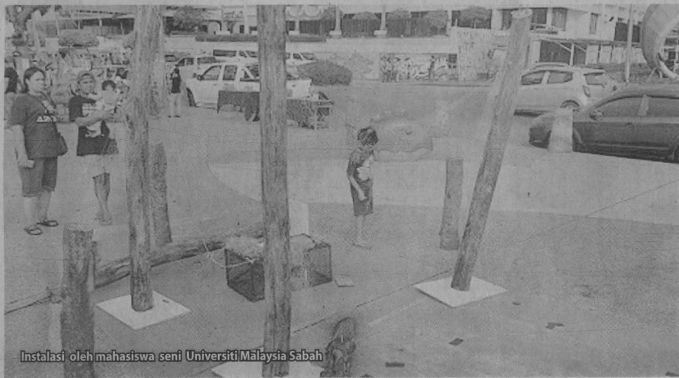
Instalasi oleh mahasiswa seni Universiti Malaysia Sabah

Tujuan aliran baru ini menjadi semakin popular adalah kerana apabila pelukis muda di barat sekitar