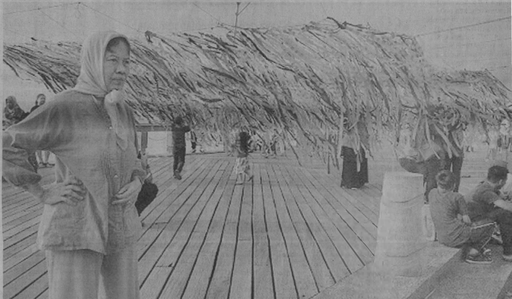
Karya Angelina bertajuk Ombak Pencemaran

Berdekatan dengan instalasi tersebut sebuah lagi karya oleh Japson Wong menggantung karya beliau dari kotak makanan plastik dan juga reben yang diikat