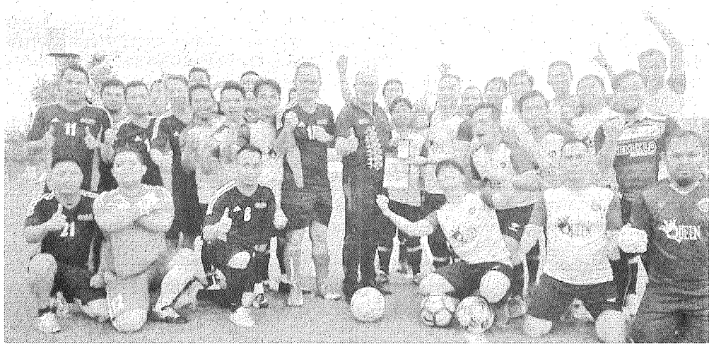
INTERAKSI ERAT: Fakulti Perubatan dan Sains Kesihatan (UMS) bersama pasukan Klinikal Hospital Queen Elizabeth (HQE) merakam gambar kenangan sebelum perlawanan dilangsungkan.

merapatkan jaringan pada separuh masa kedua dengan keputusan penuh perlawanan UMS 1-HQE 4.