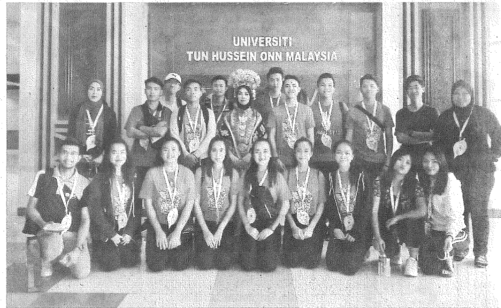
PESERTA: Sesi bergambar bersama peserta pertandingan FESTKUM.

Ianya juga adalah satu aktiviti tambahan ke-