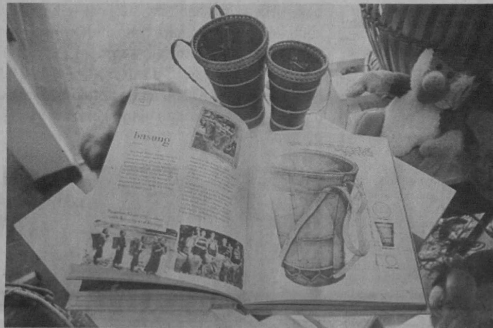
ILUSTRASI: Sebahagian dari ilustrasi buku Jenifer Linggi.

Menurut beliau lagi pada permulaan lima tahun pertama pelukis tempatan terlalu pasif bermaksud mereka tidak bermaya sebagai warga kreatif hanya menunggu jika ada acara seni yang diadakan