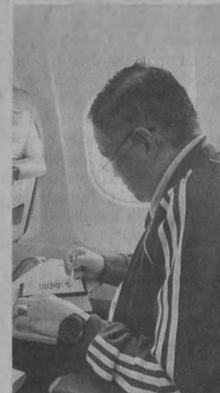
DI MANA SAHAJA: Melakar khat semasa dalam penerbangan.