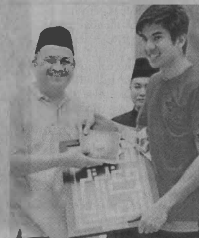
TERSOHOR: Cenderahati kaligrafi kepada pemimpin.