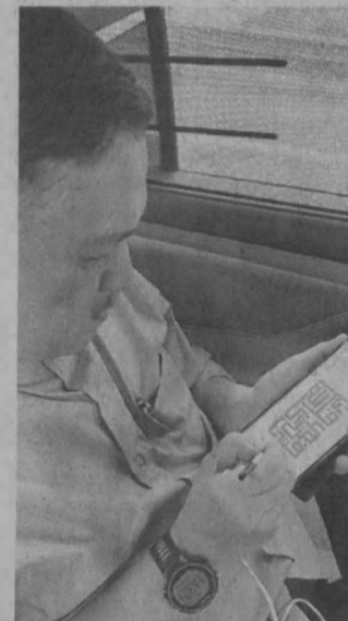
MINAT MENDALAM: Ketika melakar khat di dalam kennera.

Tujuan beliau berkarya adalah untuk melahirkan pendapat serta ingin memberikan suntikan baharu dalam seni khat berbentuk kufi.