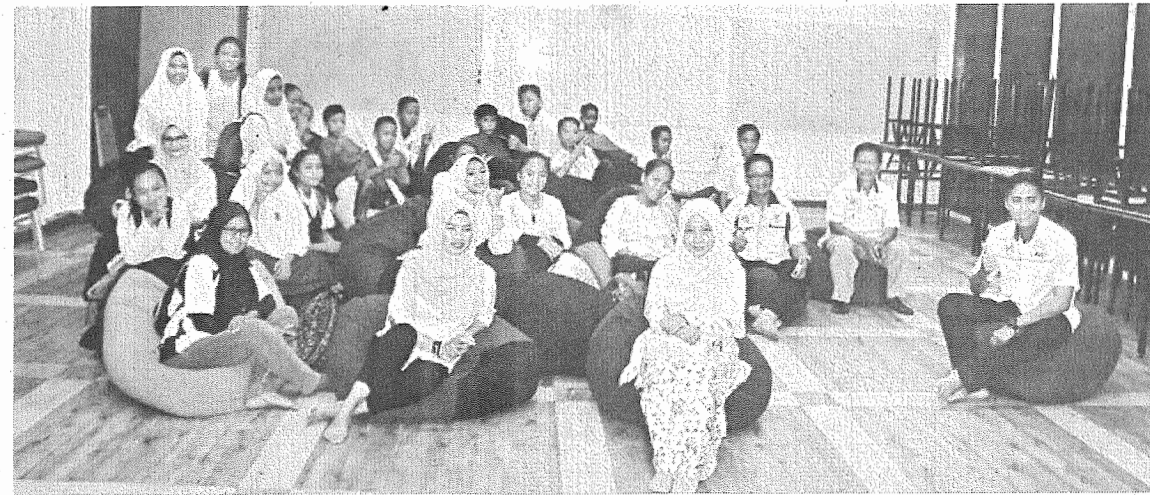
LAWAT: Murid dan guru SK Lanas melawat Bilik Eureka yang merupakan bilik serba guna untuk pelajar dan kakitangan UMSKAL mengadakan pelbagai program termasuk kuliah dan acara rasmi.