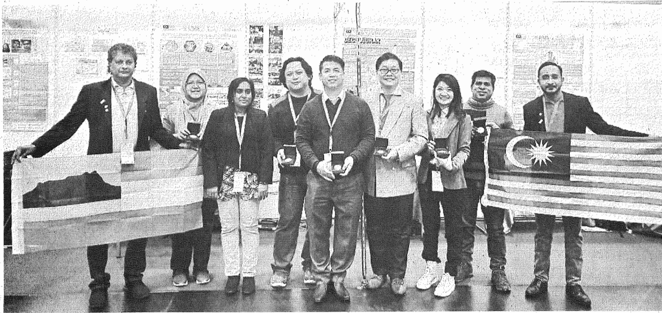
KENANGAN: Delegasi UMS ke iENA 2019 merakamkan gambar kenangan.