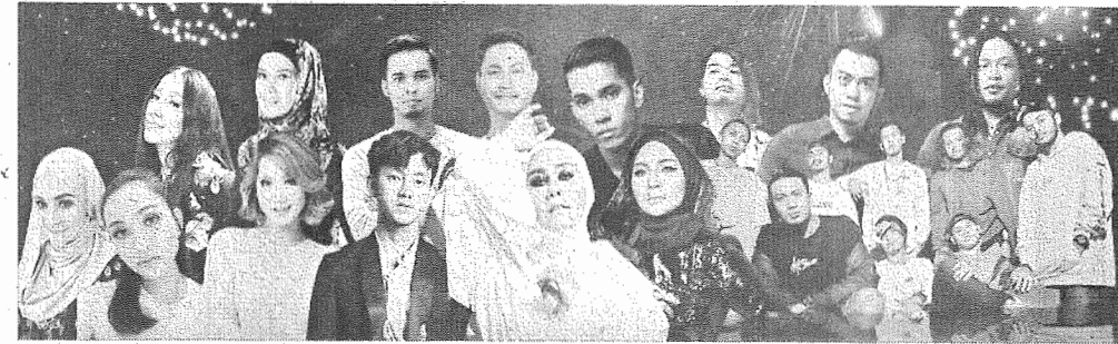
JAYAKAN TAMU: Antara Artis yang menjayakan Tamu Gadang UMS kali ke-21.

Di samping itu, terdapat hampir 5,000 cenderamata