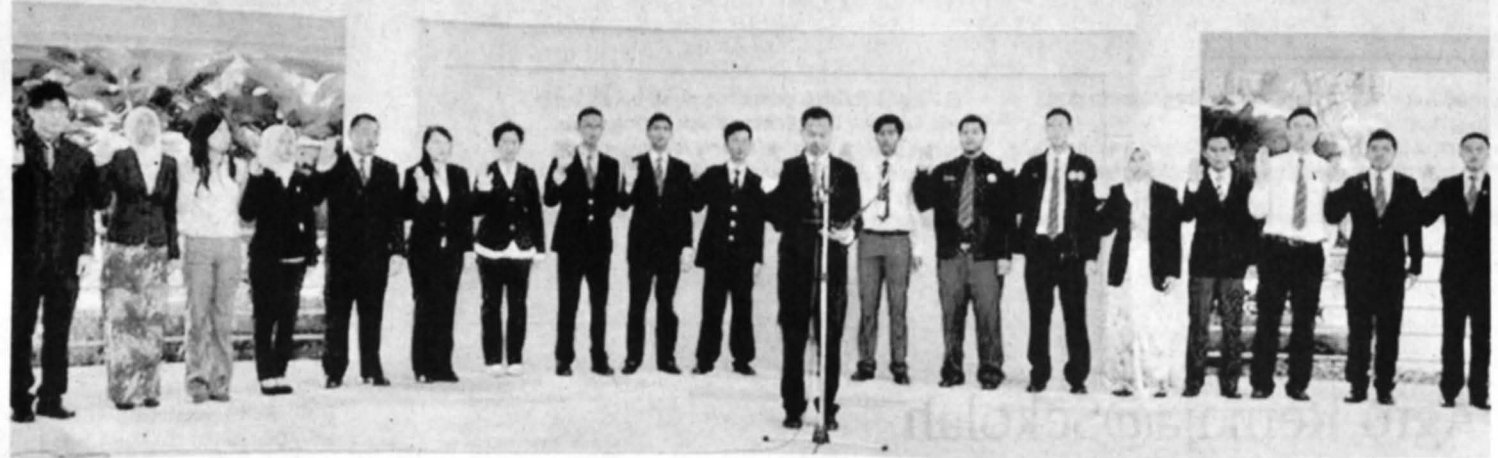
BARISAN Majlis Perwakilan Pelajar UMS yang baru pada majlis ikrar di Kota Kinabalu, baru-baru ini.